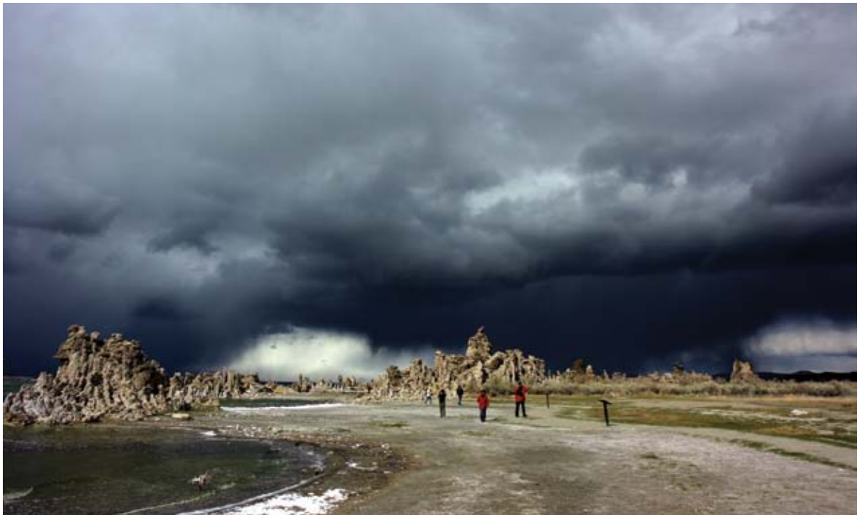
Slika 2: Udeleženci prvomajske ekskurzije v Kalifornijo leta 2010 pod vodstvom Roberta Brusa in Blaža Repeta med ogledovanjem obale ob jezeru Mono z znamenitimi lehnjakovimi in sadrenimi tvorbami, tik pred snežno nevihto.