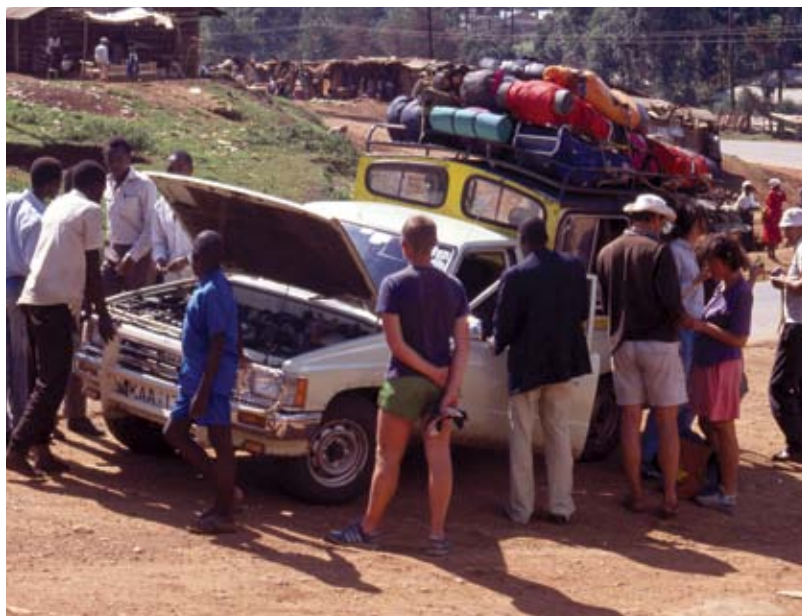
Slika 1: Udeleženci odprave v vzhodno Afriko leta 1991 med razreševanjem prevoznih zagat v kraju Kisii na zahodu Kenije, v neposredni bližini Viktorijinega jezera.

skurziji, leta 1999 v Nemčijo in leta 2001 na Dansko. Ob tem je treba dodati, da so klasične, organizirane, geografsko sicer strokovne, a vseeno bolj ali manj turistično naravnane ekskurzije, kot jih poznamo zdaj, v veljavi šele zadnjih 15 let. Pred tem so manjše skupine nekajkrat popotovale improvizirano, brez vnaprej organiziranih prenočišč in tudi ne povsem natančno določene poti. V nekaterih primerih je skorajda šlo za raziskovalne odprave. Mednje prištevamo odpravi leta 1990 v Nepal in Šrilanko ter v Prokletije in odpravi leta 1991 na Svalbard ter vzhodno Afriko.